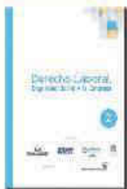
Derecho Laboral, Seguridad Social y la Empresa Autor: Varios autores ISBN: 978-958-771-173-0 Precio: $60.000 2ª edición 2017